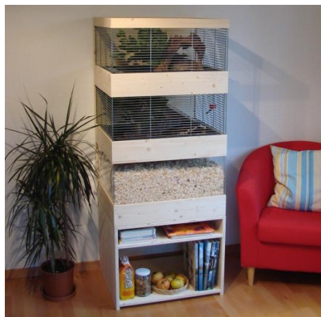
Hamster-Villa mit Wühlkiste für einen Goldhamster oder 2-3 Zwerghamster 64 x 54 cm Höhe 160 cm Totale Fläche: 1,1 m 2

Die Kleintiervilla beweist, dass ein Gehege in der Wohnung auch bei kleinen Abmessungen viel Platz für Tiere bietet und zudem praktisch und schön sein kann. Das mehrstöckige Gehege verschafft den Tieren zusätzlich abwechslungsreiche Klettermöglichkeiten und bietet Ihren Tieren naturnahen und artgerechten Lebensraum.