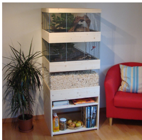
Hamster-Villa mit Wühlkiste für einen Goldhamster oder 2-3 Zwerghamster 64 x 54 cm Höhe 160 cm Totale Fläche: 1,1 m 2

Die Kleintiervilla beweist, dass ein Gehege in der Wohnung auch bei kleinen Abmessungen viel Platz für Tiere bietet und zudem praktisch und schön sein kann. Das mehrstöckige Gehege verschafft den Tieren zusätzlich abwechslungsreiche Klettermöglichkeiten und bietet Ihren Tieren naturnahen und artgerechten Lebensraum.