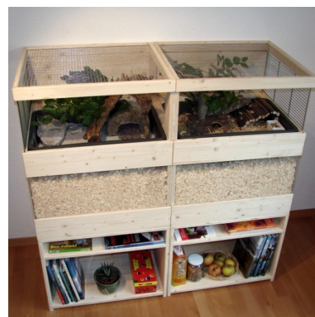
Rennmaus-Villa mit Wühlkiste für 5 Rennmäuse 128 x 54 cm Höhe 128 cm Totale Fläche: 1,5 m 2

Was liegt näher als zwei praktische Ideen miteinander zu verbinden: die aufeinander gestellten und durch Treppen verbundenen Stockwerke bringen viel Platz auf kleiner Standfläche.