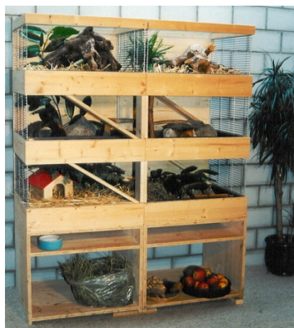
Meerschweinchen-Villa für 2-3 Meerschweinchen oder 5 Ratten 128 x 54 cm Höhe 160 cm Totale Fläche: 2,2 m 2