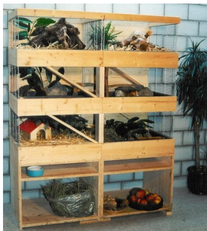
Meerschweinchen-Villa für 2-3 Meerschweinchen oder 5 Ratten 128 x 54 cm Höhe 160 cm Totale Fläche: 2,2 m 2